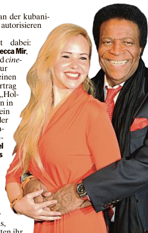
Glücklich und bald auch kirchlich verheiratet: Roberto Blanco und seine schöne Luzandra